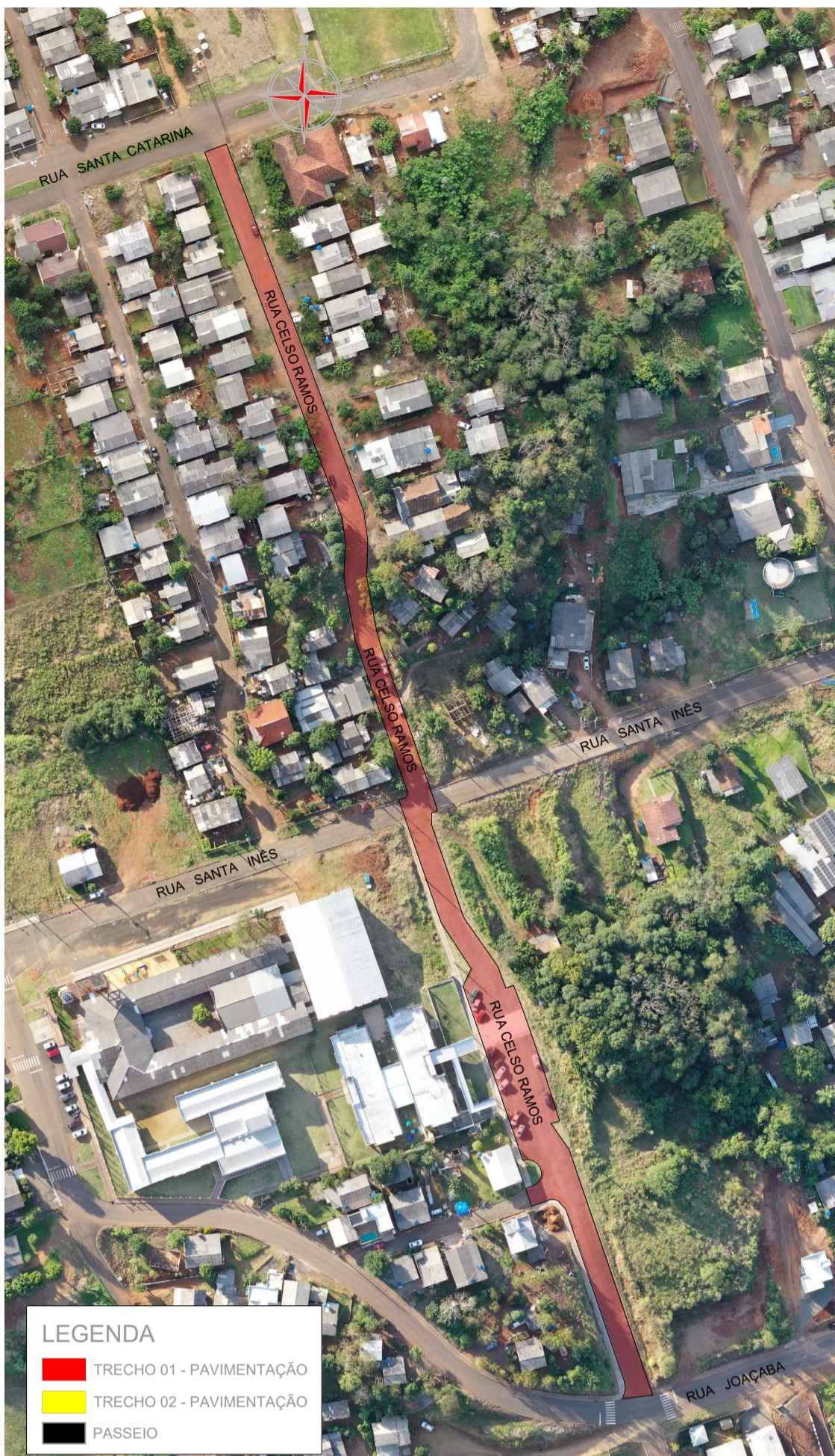
PLANTA DE SITUAÇÃO Esc: 1/1750