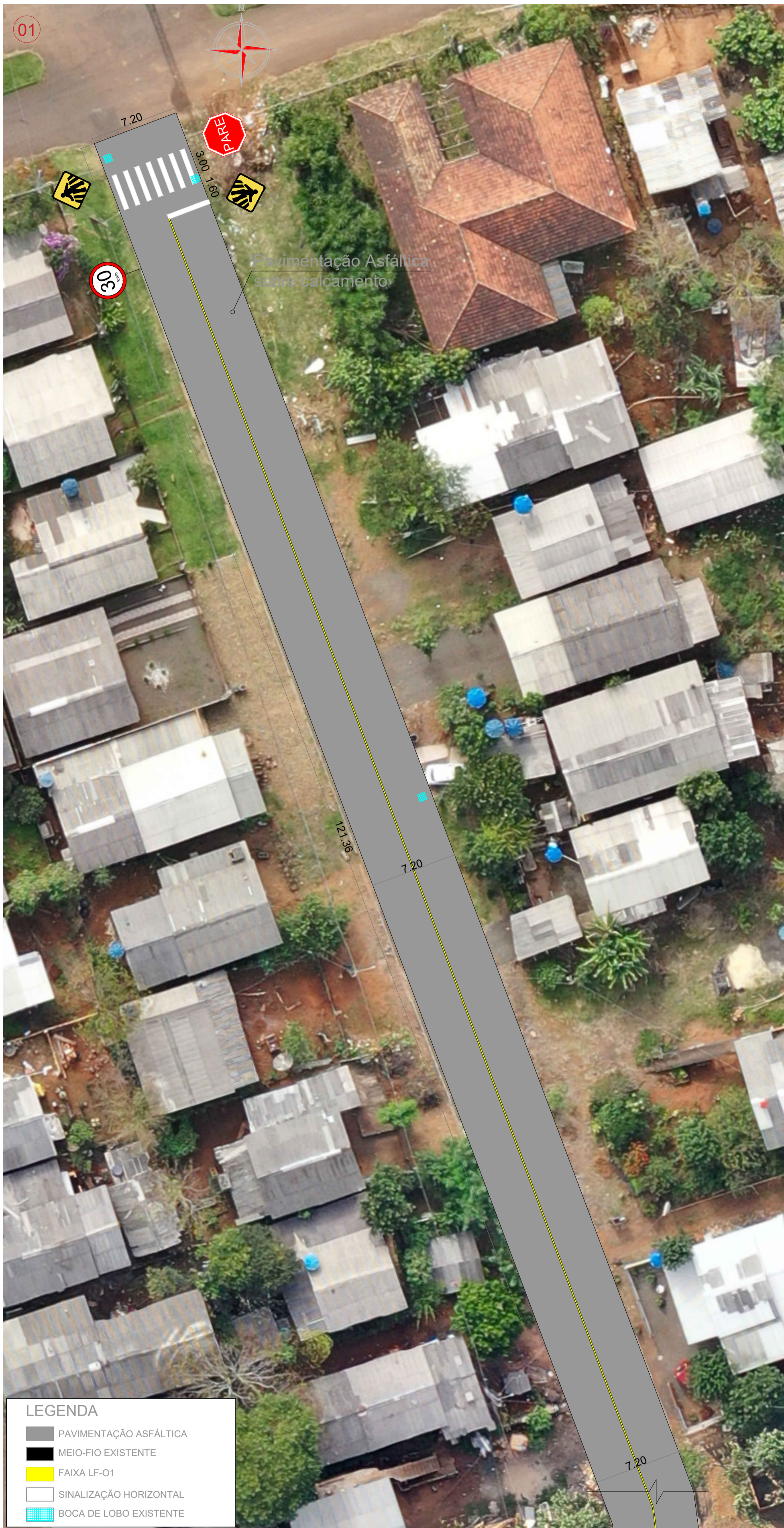
PLANTA BAIXA - RUA CELSO RAMOS Esc: 1/250 Área: 3.468,12m²