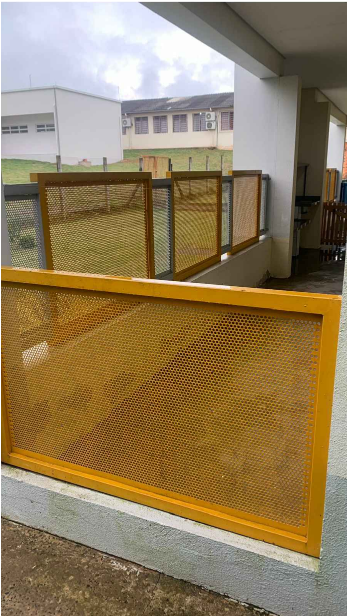
Grades perfuradas (06) - Creche Pingo de Gente Escala 1:25