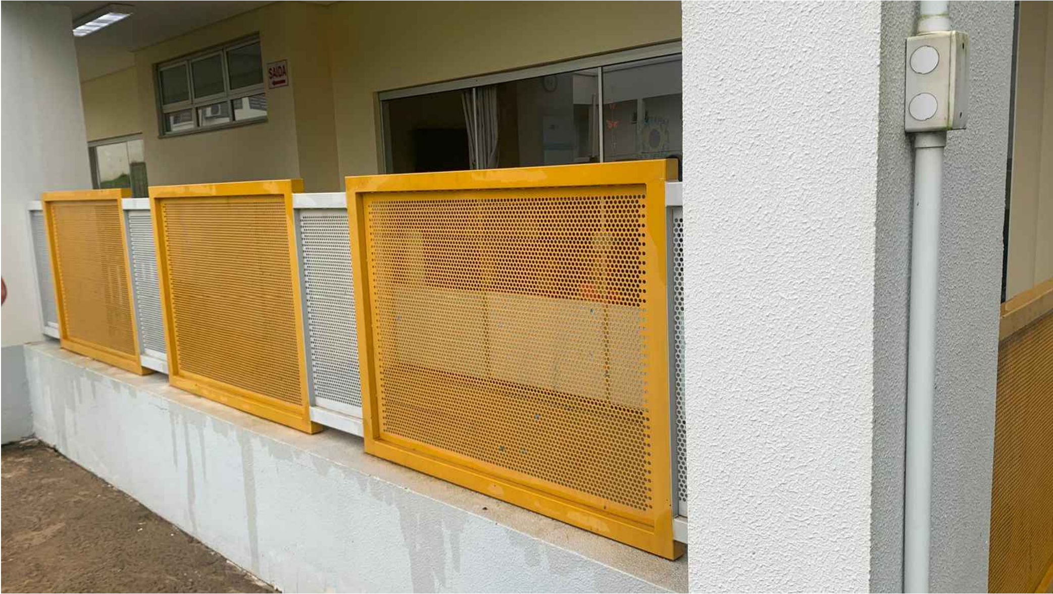
Grades perfuradas (04) - Creche Pingo de Gente Escala 1:25