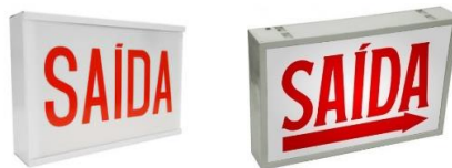
Placas de sinalização de saída autônomas. Imagens meramente ilustrativas.

Será composta por placas fotoluminescentes de PVC 24x12cm (LxA) com sinalização de “SAÍDA”, com fundo verde e letras brancas, instaladas conforme alocação em projeto. Onde houver mudança de direção, as placas deverão possuir seta indicativa do sentido de rota de fuga.