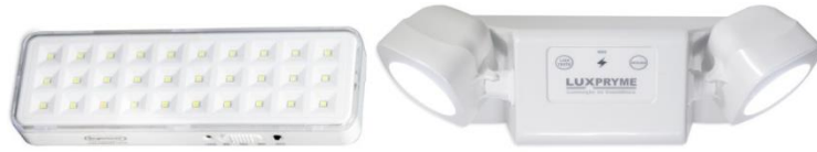
Luminária 30 LEDS e 2 faróis, respectivamente. Imagens meramente ilustrativas.

conhecidas como do tipo 30 LEDS e do tipo 2 faróis. As luminárias estão distribuídas de modo a atender o nível mínimo de iluminação de 3 lux em locais planos (corredores, halls, áreas de refúgio, salas, etc.); e de 5 lux em locais com desnível (escadas, rampas ou passagens com obstáculos).