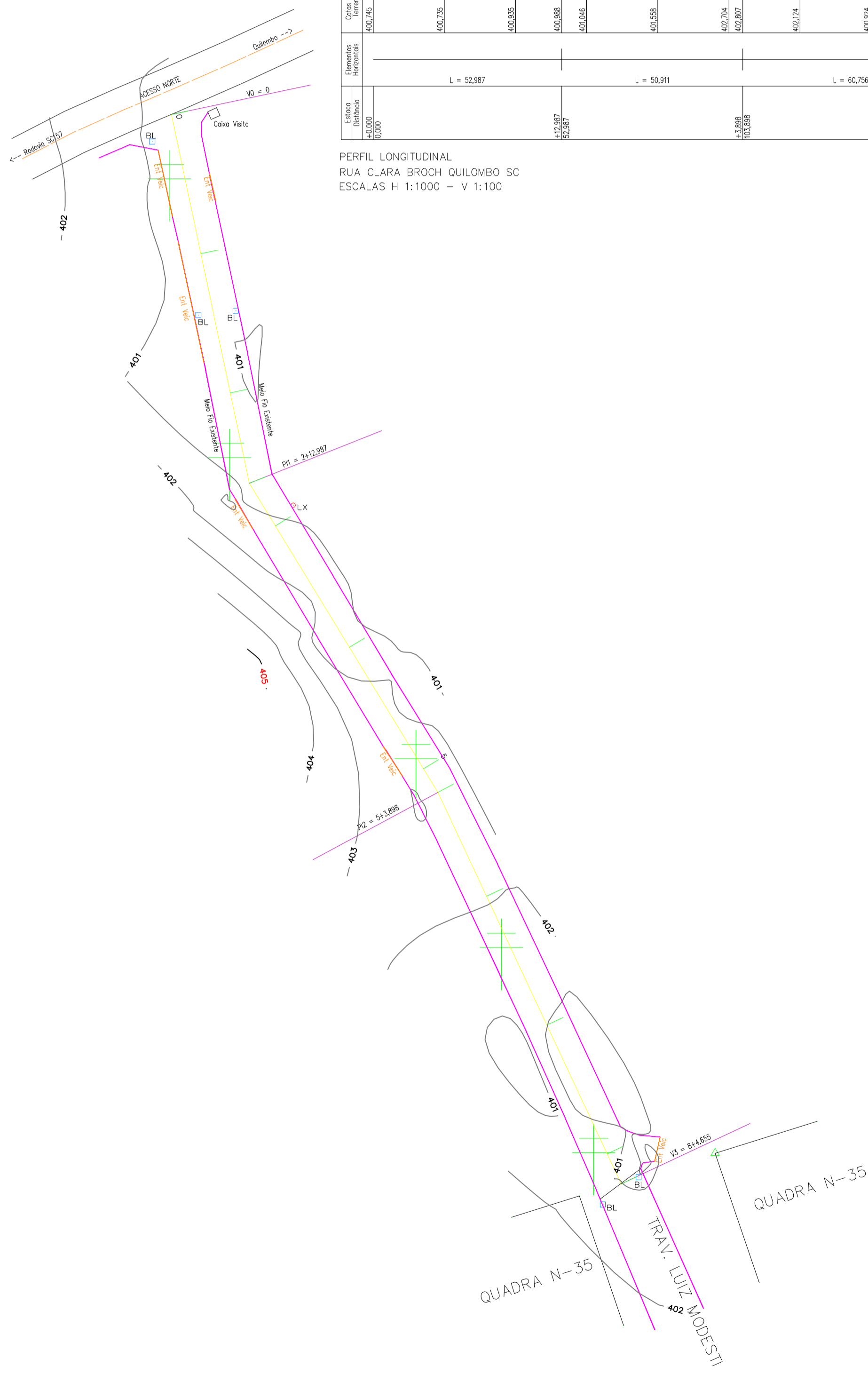
IMPLANTAÇÃO - PLANIALTIMÉTRICO Escala 1/500