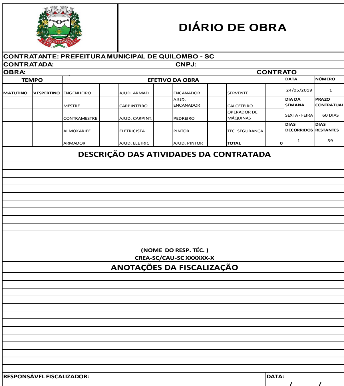
Fig. Modelo de diário de obra.