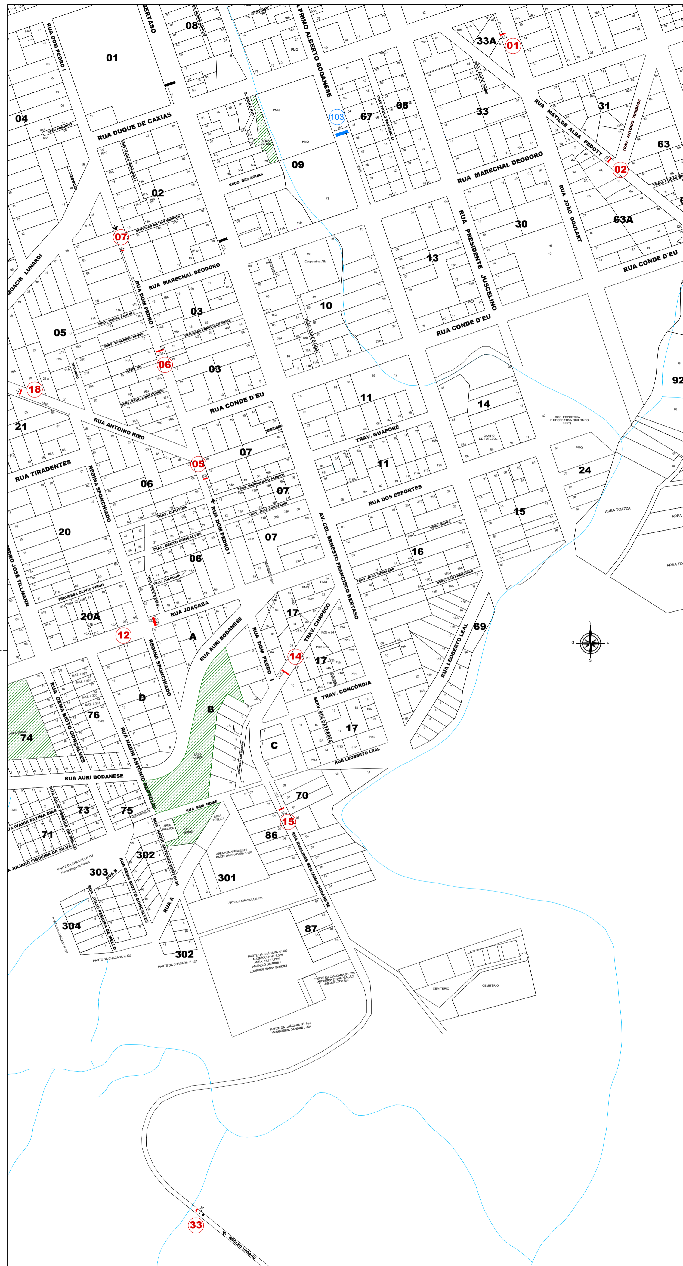
ÁREA 01 ESCALA: VISUAL