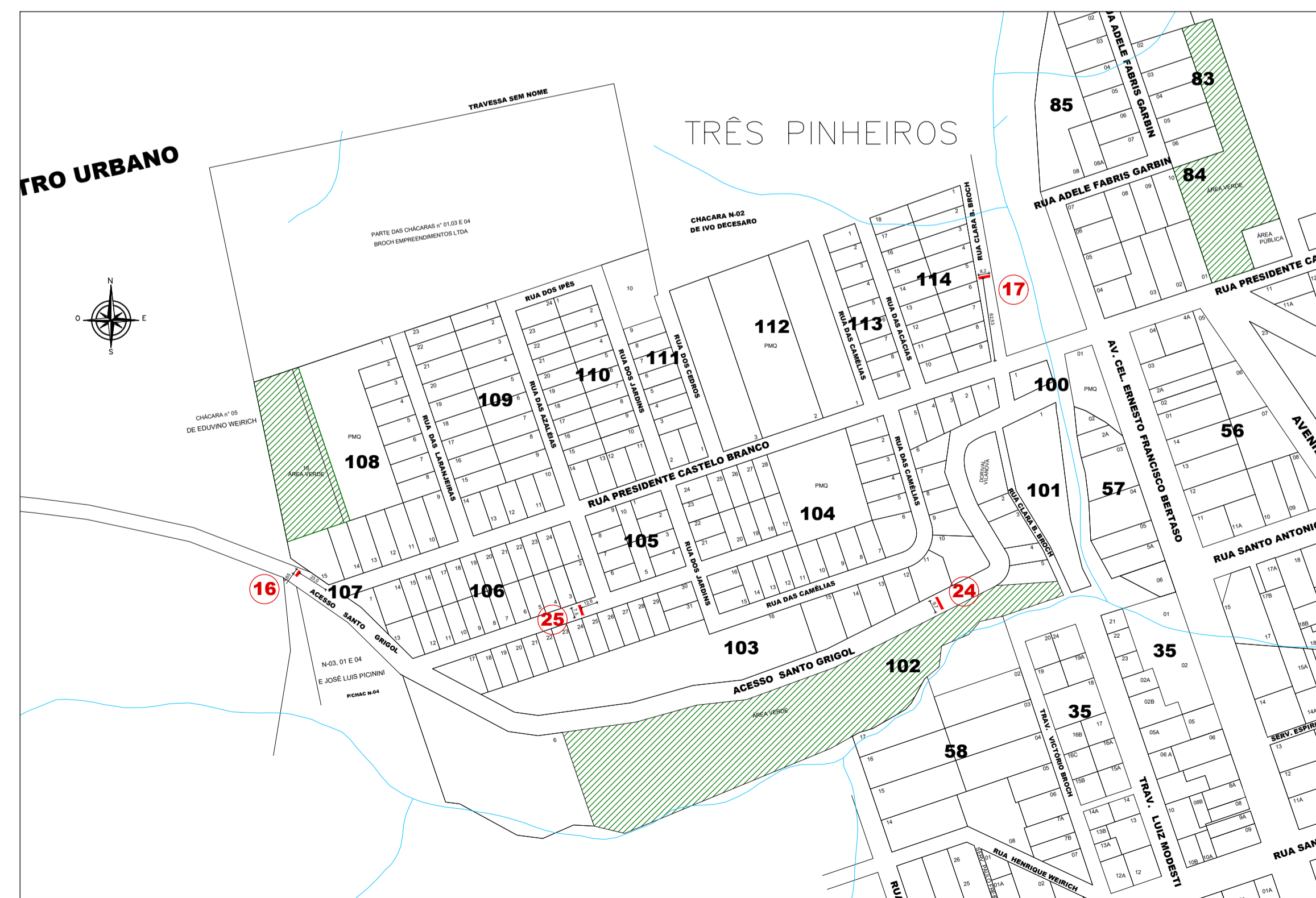
ÁREA 03 ESCALA: VISUAL