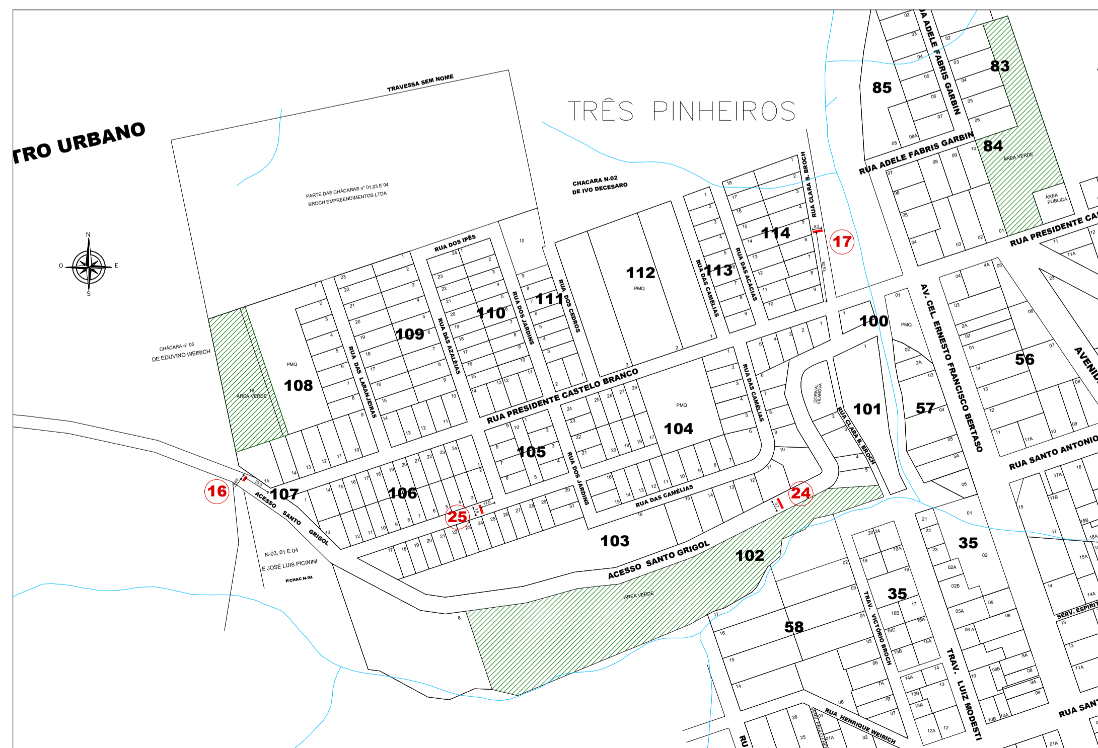
ÁREA 03 ESCALA: VISUAL