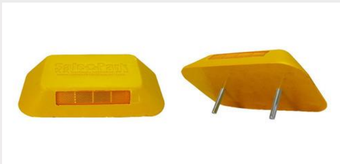
Figura 1 – Tachão