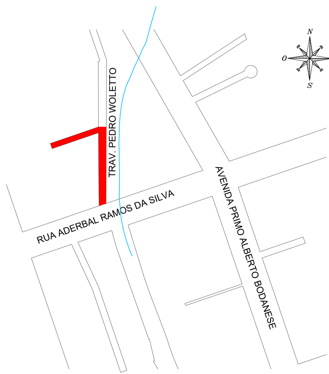
DETALHE PLANTA DE LOCALIZAÇÃO TRAVESSA PEDRO WOBETTO Escala: _____ 1:2000 LEGENDA ■ ÁREA A SER PAVIMENTADA