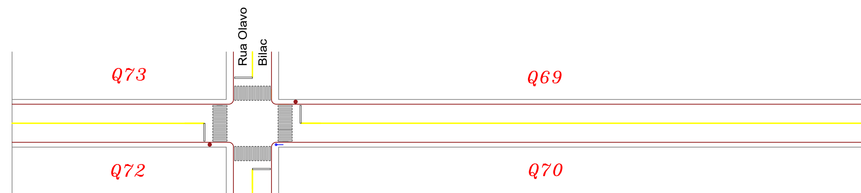
SINALIZAÇÃO VIÁRIA - RUA SANTO AGOSTINHO